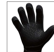
滑り止めグリップ ポリウレタンエンボス加工による滑り止めと摩擦防止。