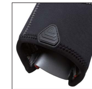
グローブグリップタブ 適切な場所、優れたグリップ。二つめのグローブを装着する際も完璧にサポートします。